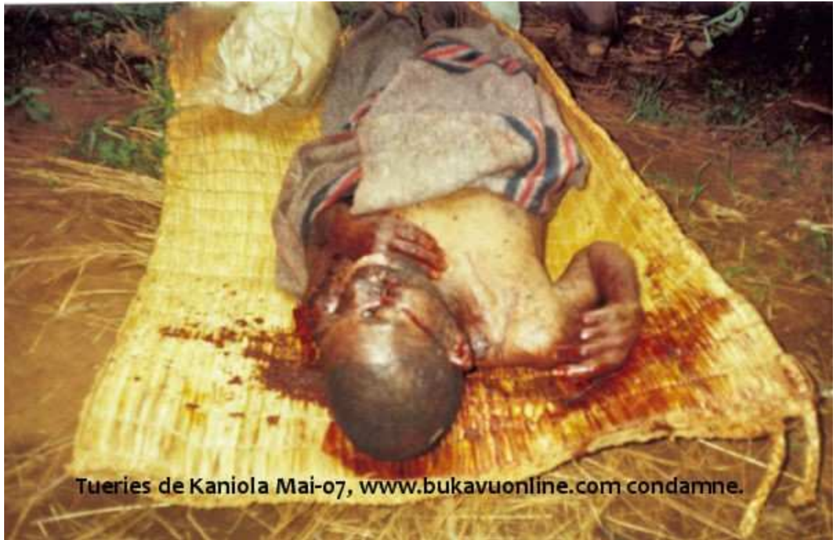
Tueries de Kaniola Mai-07, www.bukavuonline.com condamne.