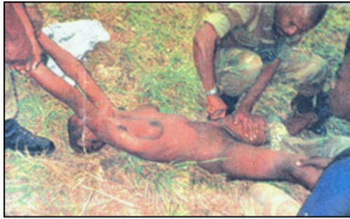
TUERIE EN ITURI